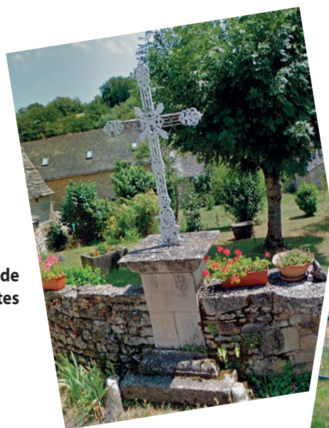
Croix de Cassagnettes

La réflexion sur le futur règlement porte également sur les éléments qui fondent le paysage et en particulier le petit patrimoine. Afin d'alimenter la réflexion des élus sur les prescriptions à appliquer à ces éléments qui ponctuent notre territoire et participent à sa qualité paysagère, un inventaire des éléments qui constituent le patrimoine vernaculaire de la Commune a été réalisé... Ainsi ce sont près de 72 éléments qui ont été recensés, allant de croix, fours, pigeonniers, sources et puits, cascades, aux châteaux et maisons.