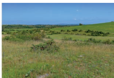
Mont Aubert 2021