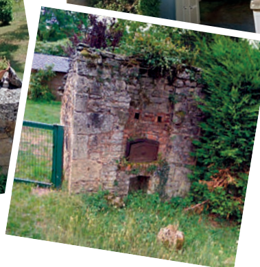
Four de Ronne