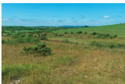
Mont Aubert 2018

Retrouvez toutes les informations sur https://paysageaveyron.fr/13-f7-mont-aubert-salles-la-source/