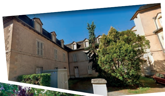
Hospice de Salles-la-Source